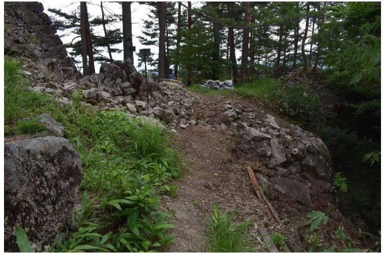
松倉城三ノ丸埋門(北側から撮影)