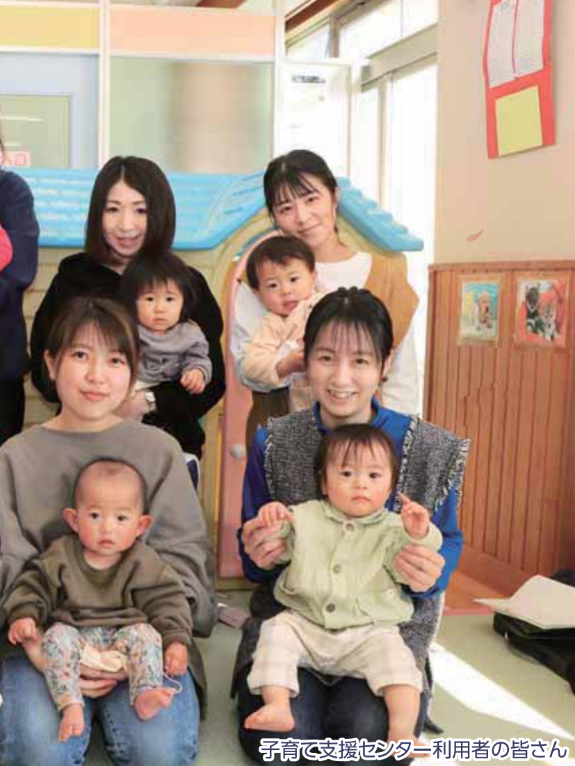
子育て支援センター利用者の皆さん

子育ては、楽しいことや嬉しいことがある反面、不安や戸惑うこともたくさんありますよね。 市では、皆さんが安心して子育てができる環境を整えるために、 妊娠期から子育て期まで途切れのない支援を行っています。 親が笑顔だと、子どもも笑顔になります。親も子どもも笑顔でHAPPYな気持ちで過ごせるように、 市の子育て支援を活用してくださいね！