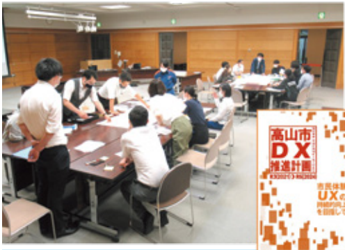
高山市DX推進計画の策定・官民連携によるDX推進部会の活動(若手職員らによるDX推進ワークショップ)