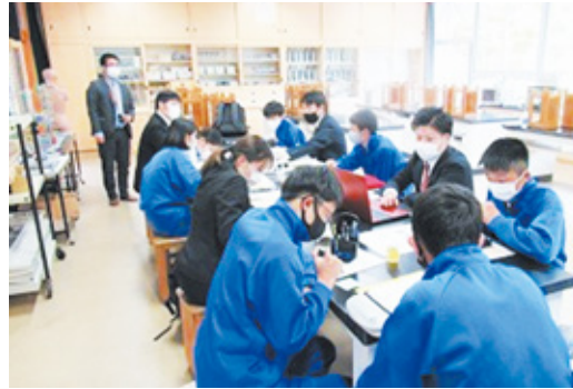
市民団体などとの協働によるまちづくり活動(多摩大生と久々野中生徒によるSNS情報発信ワークショップ)