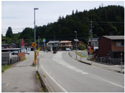
江名子町側坑口【写真③】