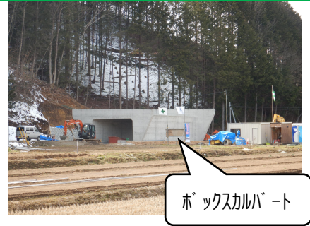
ボックスカルバート