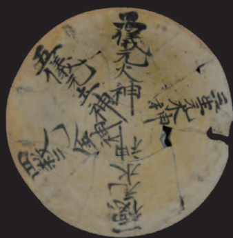
江馬氏城館跡下館跡出土 墨書土師器皿 (飛驒市蔵)

中世の飛驒 は国司姉小路氏、守護京極氏、北飛驒を拠点とした江馬氏、京極氏の代官を務めていた三木氏などが割拠し、三木自綱が天正十一年(一五八三)に飛驒を掌握するまで、国内は争乱が続いた。北の上杉氏、東の武田氏、南の織田氏からの影響を受けた飛驒の国人は、時に国外勢力と組みながら、勢力の拡大を図った。