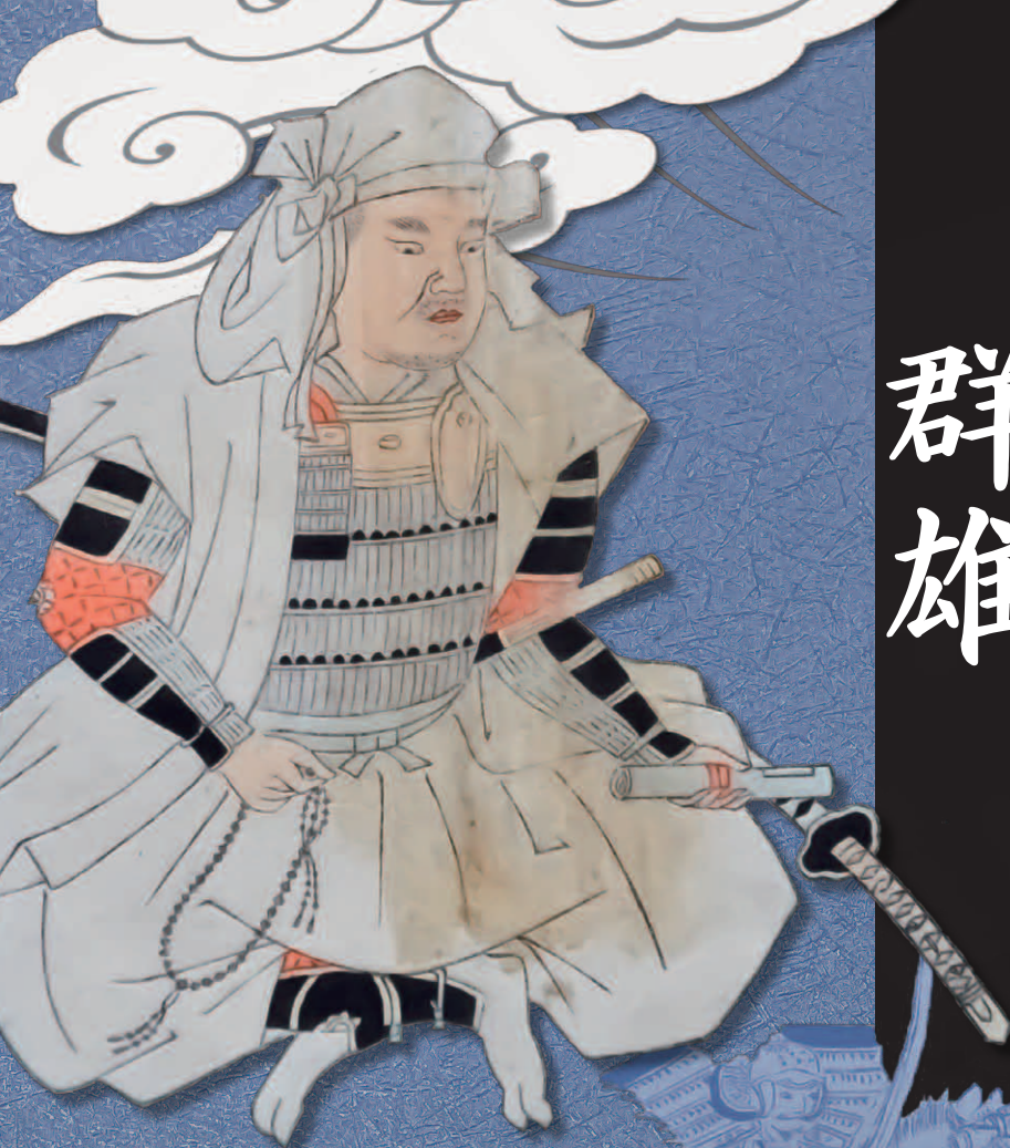
三木自綱肖像画 (角竹郷土史料文庫蔵)