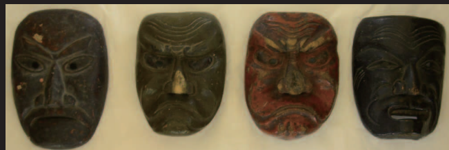
舞楽面 (荒城神社蔵)