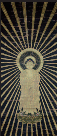
方便法身尊形 (東等寺蔵)