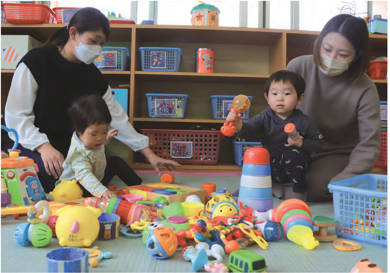
子育て支援センター（岡本保育園 2階・岡本町3）の様子