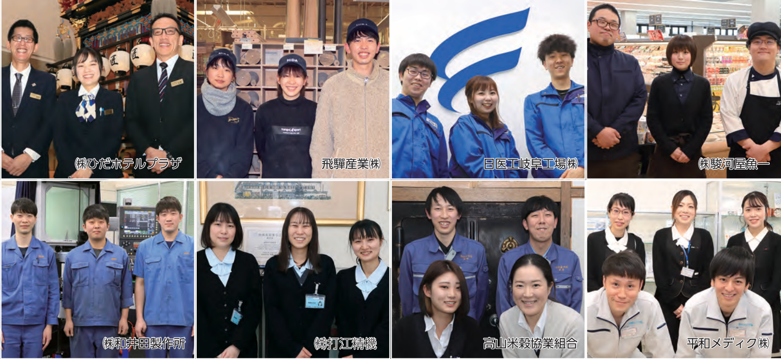
多くの地元の企業で活躍する皆さんの中から一部を紹介(市雇用促進協議会協力)