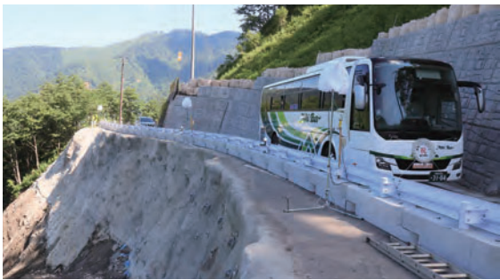
7 復旧開通した乗鞍スカイライン