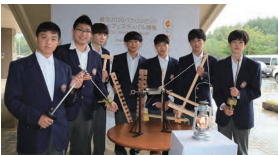
9 聖火を起こす機材などを製作した高山工業高校生徒の皆さん