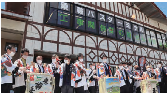
7 乗鞍スカイラインの復旧開通を盛大にお祝い