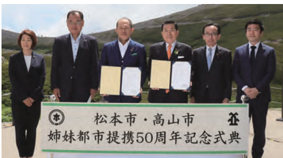
8 両市の交流や観光振興などの共同宣言に署名