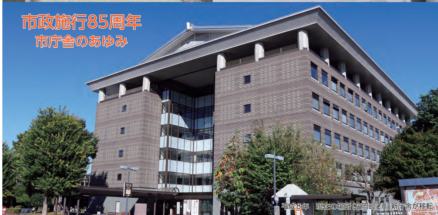
平成8年 現在の場所(花岡町2)に新庁舎が移転