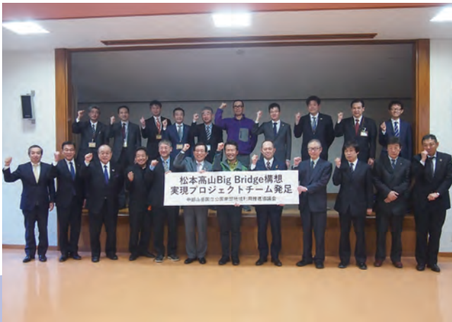
4/5 松本高山Big Bridge構想実現プロジェクトチームが発足しました。これは、中部山岳国立公園を挟む高山市街地と松本市街地の横断ルートを、魅力的な観光ルートに磨き上げていく取り組みです。