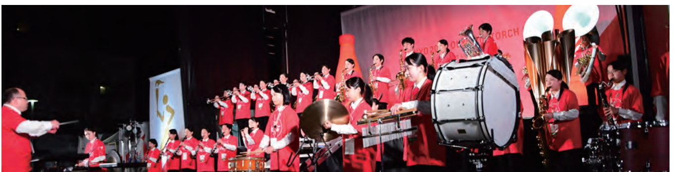
到着地の駅西交流広場を盛り上げる高山西高ウインドアンサンブル部