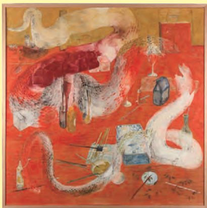
▶第27回大賞「いだらぼっちver.1」