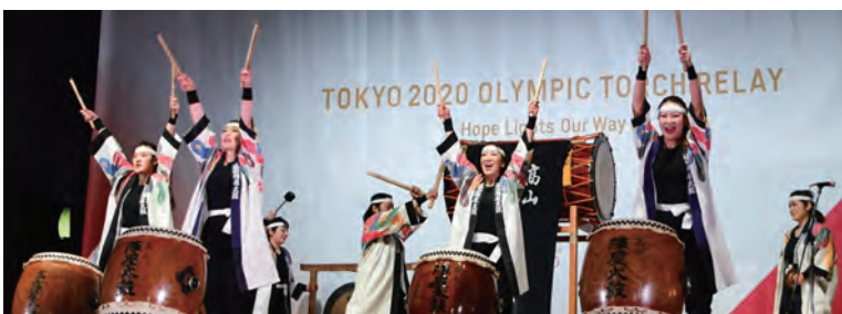
到着地の駅西交流広場を盛り上げる高山陣屋太鼓保存会