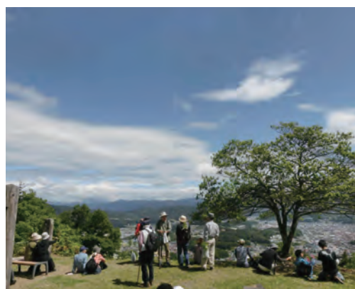
新型コロナ対策とクマ対策をお願いします。