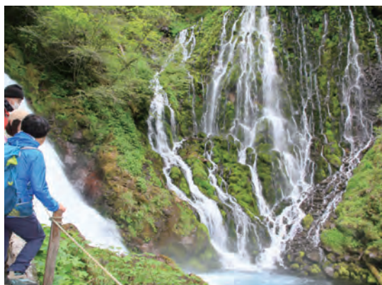
▲第16回エコツーリズム大賞(環境大臣賞)を受賞