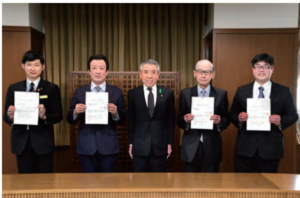
▲3月24日(水)に認定証交付式を行いました。