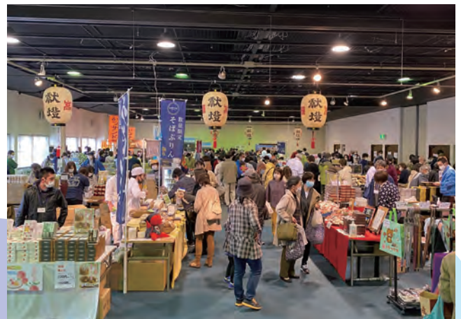
4/17 新型コロナの影響で大きなダメージを受けている地場産品や土産品を売り出そうと、18日までの2日間、市内で飛騨高山展in HIDA TAKAYAMAが実施されました。