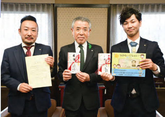
4/1 高山商工会議所青年部 (YEG) の皆さんから、市内の子どもたちへオリジナルの絵本が寄贈されました。絵本は各小学校の図書館で活用させていただきます。