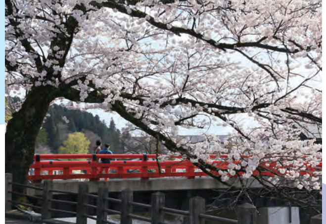
4/4 昨年よりも2週間ほど早く、中橋の桜(標準木)が満開に。ぽかぽかとした陽気に誘われて、冷涼な地域でも例年より早く開花しました(撮影は4月8日)。