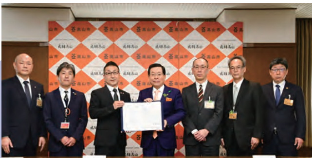
災害時における停電復旧に係る応急措置の実施の支障となる障害物等の除去等に関する協定 締結式