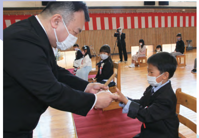
4/6 市内小中学校では、1,464人が入学しました(写真は岩滝小の入学式の様子)。新小学1年生には、木に親しみを持ってもらうために、毎年、地元の杉で作られた鉛筆と木のものさしをプレゼントしています。