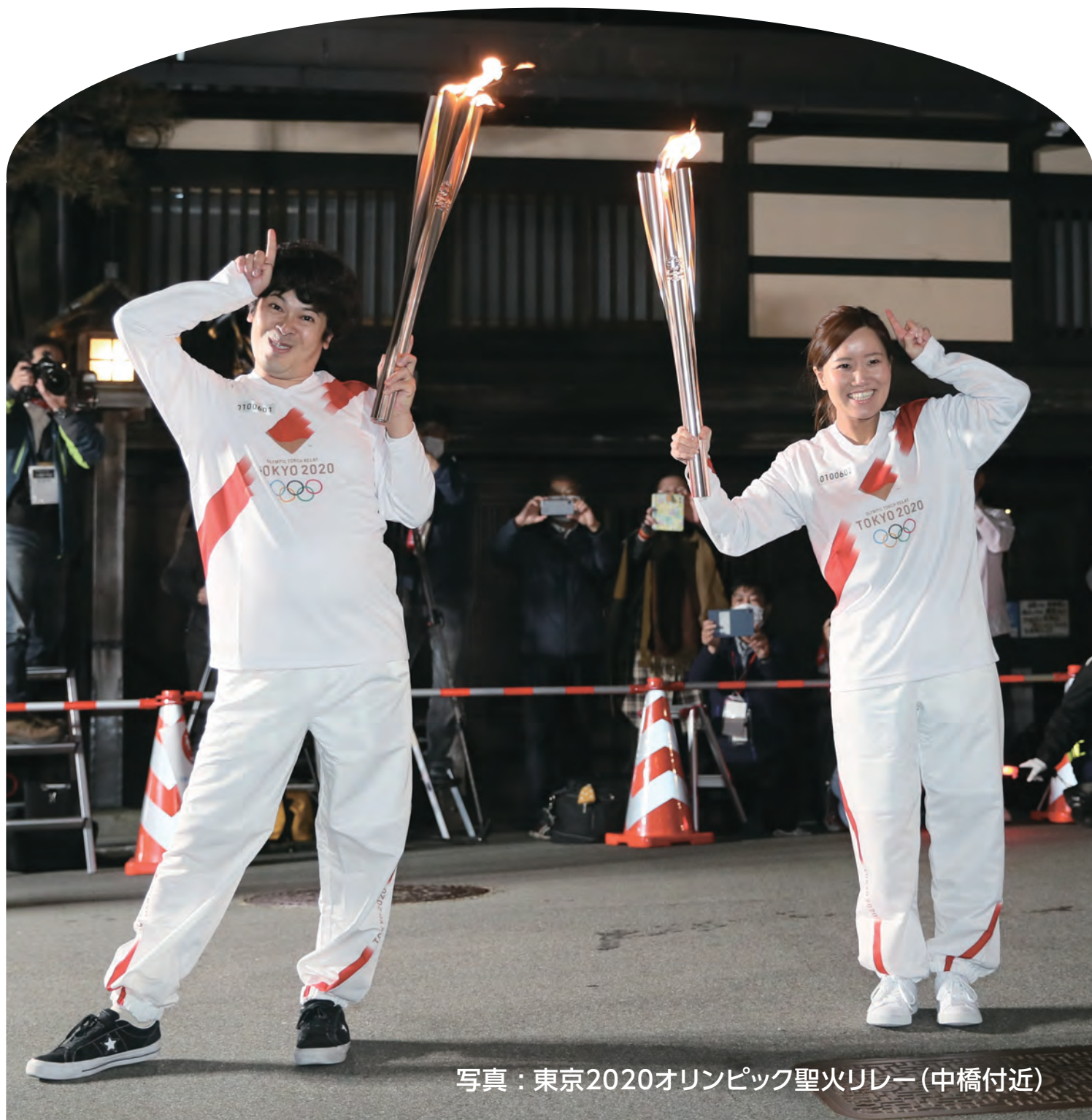
写真：東京2020オリンピック聖火リレー（中橋付近）