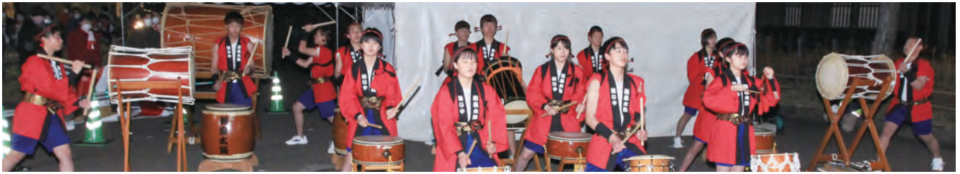
出発地の陣屋前広場を「清流太鼓」で盛り上げる朝日中学生