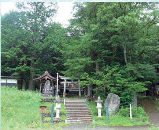
一位森八幡神社社叢

通りました。生糸の輸出を支えた女工史は、小説や映画「あゝ野麦峠」でも語られています。現在、旧街道は、ハイキングコースにもなっており、新緑、紅葉を眺めながら森林浴が楽しめます。