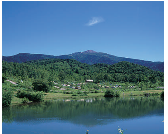
子ノ原高原からの乗鞍岳

野麦峠 のむぎわらげ 標高1,672mの野麦峠につながる旧野麦街道は、鎌倉街道、江戸街道とも呼ばれ、飛騨と信濃を結ぶ重要幹線道路のひとつでした。明治から大正時代には、製糸工女として出稼ぎに向かう娘たちも