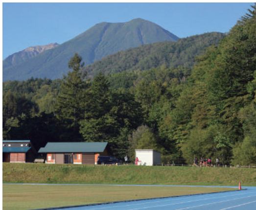
ハイランド陸上競技場と御嶽山