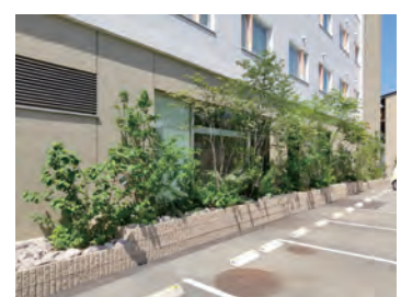
スパホテルアルピナ飛騨高山 花壇