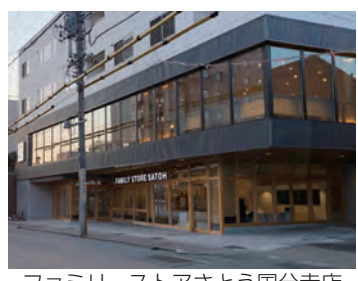
ファミリーストアさとう国分寺店

※奨励賞は優秀賞の次点に相当する表彰です。 ※各作品の講評は市HPに掲載しています。 ※サインの部の受賞作品はありませんでした。