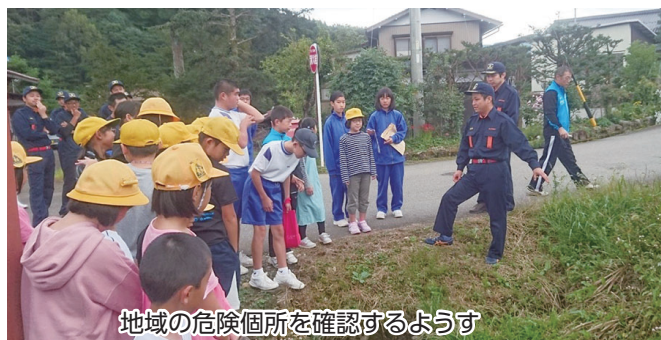
地域の危険個所を確認するようす

久々野地域では、「久々野の子どもを育てる会」が主催して、防災学習を平成26年度から実施し、平成31年度は779人が参加しました。