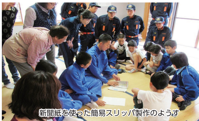
新聞紙を使った簡易スリッパ製作のようす

各地区ごとに自主防災組織や町内会、消防団員が主体となり、日赤奉仕団の協力のもと小中学生も参加して、水害時の身の守り方、地域の危険個所や避難場所などについて確認しました。また倒壊家屋救出や放水などの訓練、防災〇×クイズ、新聞紙を使った簡易スリッパの製作など、災害時に役立つ知識を地域全体で学びました。