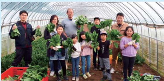
ほうれんそうツアー

地場産農林水産物の魅力を体感するため、市内の農家を訪問し、農業体験をしています。