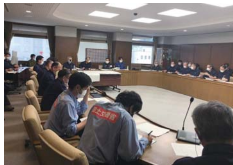
災害対策本部では、各支所や消防署員とテレビ中継で状況を確認しながら対応にあたりました。