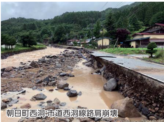
朝日町西洞:市道西洞線路肩崩壊

7月9日午後1時30分には、土砂災害警戒情報が解除されたため、市内全域に発令していた警戒レベル4 避難指示は解除しました。しかし、7月11日午後5時30分に再び土砂災害警戒情報が発表されたため、高根町の一部に警戒レベル4 避難勧告を発令しました。