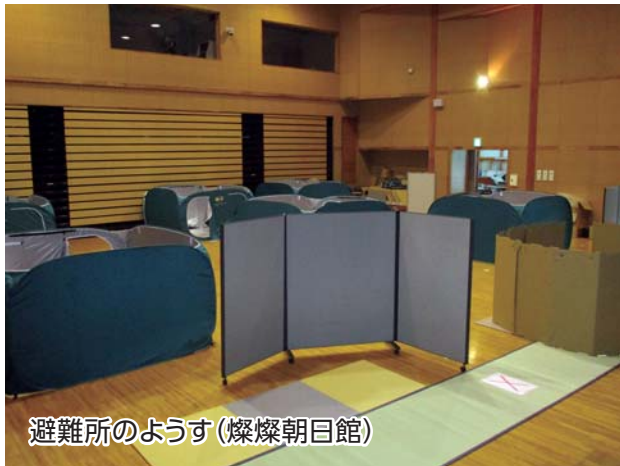
避難所のようす(燦燦朝日館)

また、今回、避難所では検温などの体調確認や密にならないよう一定の間隔を開けた居住スペースの確保、体調の悪い方を別室に区分けするなど、新型コロナウイルス感染症予防に対応した避難所の運営を行いました。