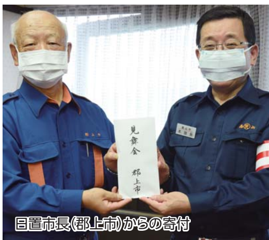
目置市長(郡上市)からの寄付