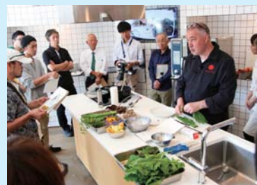
料理教室のようす

飛驒高山ブランドを応援し魅力を配信する、市アンバサダーを活用し、世界的シェフの視点で高山の食材の魅力や活用方法を伝えていただくことを目的として、市内シェフ向けに明日のメニューにすぐに活かせる地場産農林水産物活用講座を行っています。