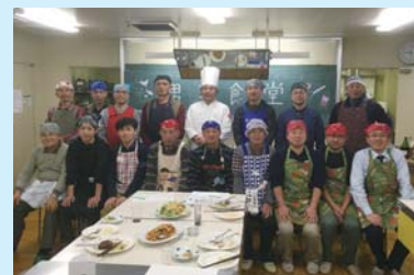
市民向け料理教室のようす