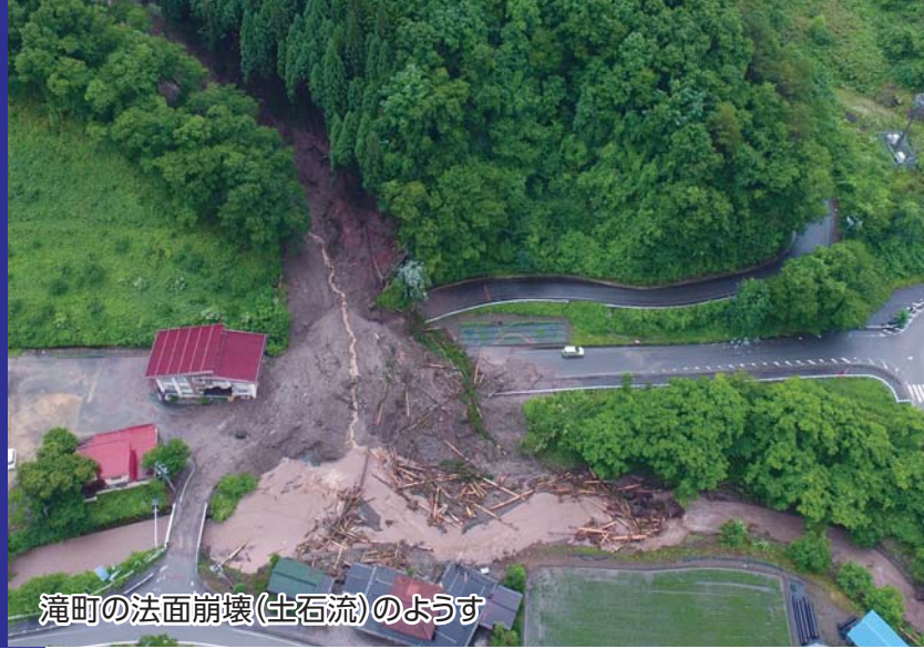
滝町の法面崩壊(土石流)のようす