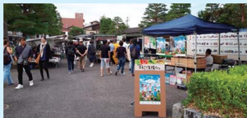
マルシェのようす

市民の皆さんに地場産農林水産物や6次産業化商品を知っていただくために生産者による販売や情報発信、体験教室などのマルシェを行っています。