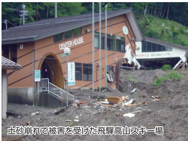
土砂崩れで被害を受けた飛騨高山スキー場