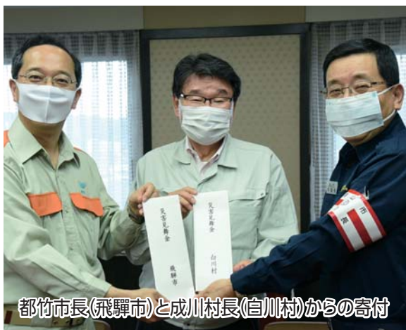
都竹市長(飛騨市)と成川村長(白川村)からの寄付

飛騨市・白川村・郡上市からの災害見舞金のほか、市内事業者からも多数の寄付がありました。寄付金は、災害の復旧のために活用させていただきます。