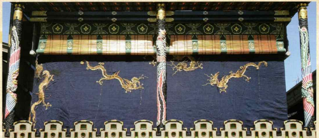
日枝鳳凰台旧桐幕(約200年前に使われた幕)

飛騨には多くの神社仏閣があり、人々の厚い信仰によって支えられてきました。江戸時代中期には存在した飛騨七観音、高山祭の豪華絢爛な屋台などを中心に展示し、飛騨人の心情に迫ります。