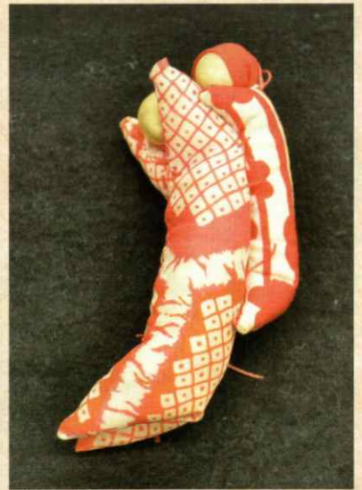
さるぼぼ(戦前に作られたもの)