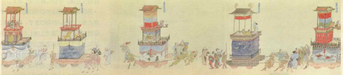
山王祭礼行列絵巻