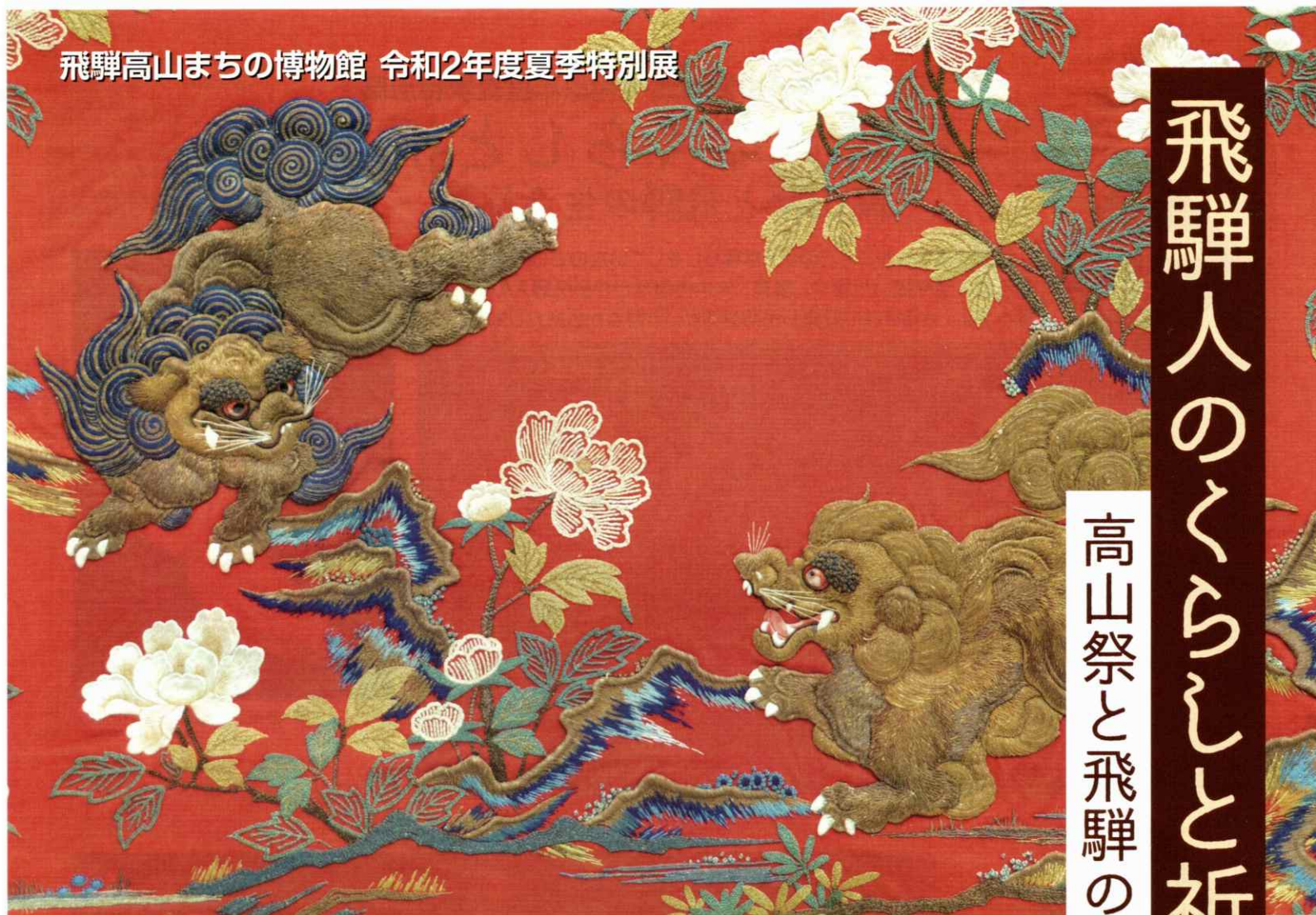
五台山旧中段刺繍幕(円山応挙による下絵)