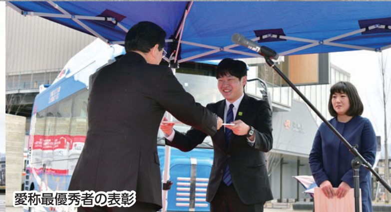
愛称最優秀者の表彰