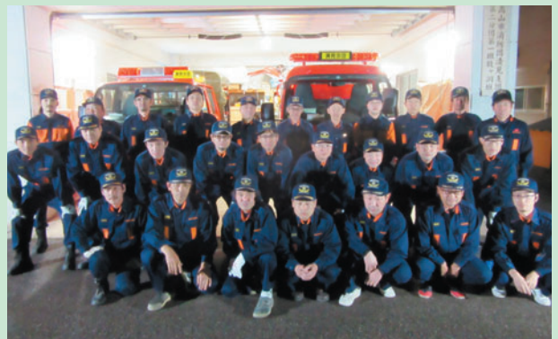
清見支団 第2分団の皆さん