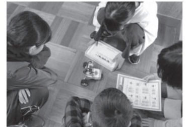
グループでプログラミングを組み実際にLEGOロボットを動かす子どもたち