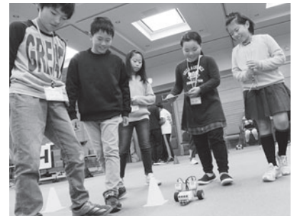
昨年の講座のようす