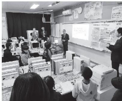
県立高山工業高等学校の皆さんとのプログラミング教室