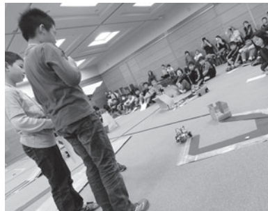
考えたアイデアの発表会(今年)