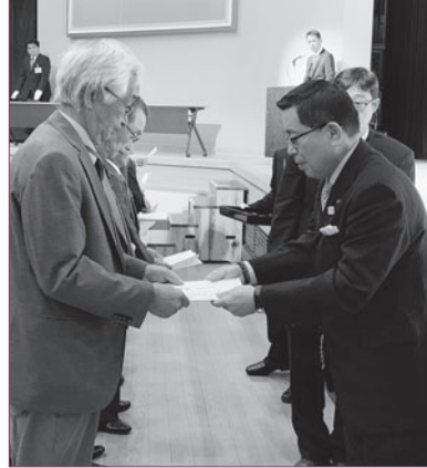
委嘱辞令伝達式の様子 (12月1日・市民文化会館)

民生児童委員と主任児童委員の改選が行われ、226名の方々が厚生労働大臣から委嘱されました。 民生児童委員は、高齢者などへの援護活動をはじめ、子どもが健やかに育つ環境づくりや、さまざまな問題を抱えた方の相談や援助をにあたります。また、主任児童委員は児童福祉関係機関との連携や調整を行ったり、民生児童委員と協力して必要な援助をします。 委嘱された方々は、令和4年11月30日までの任期の間、地域福祉の担い手として重要な役割を果たされます。