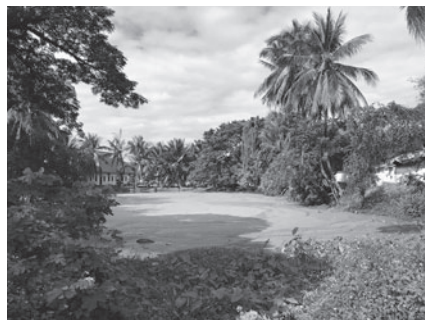
ルアンパバーンのため池