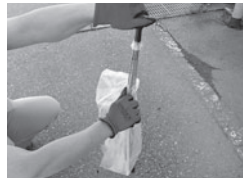
②そのまま持ち手の方に引き抜きます