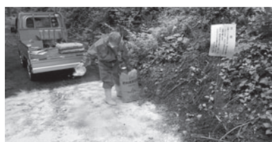
養豚農場を中心とした半径3km圏内にある林道出入口に消毒薬を散布しています

問合せ 農務課 ☎35-3141 (休日夜間は☎32-3333) 広報ID 1010847