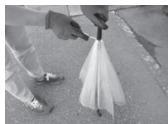
①傘の先の生地をカッターなどで切ります