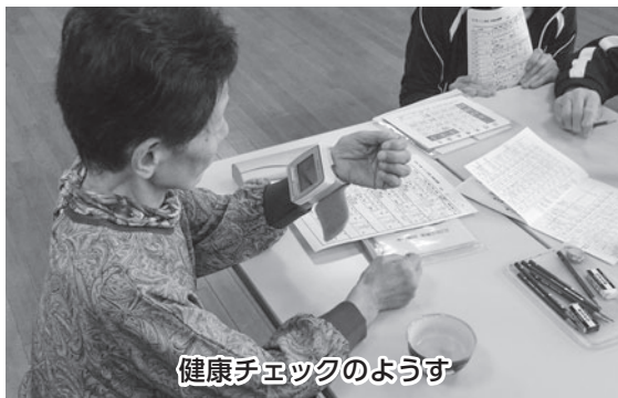
健康チェックのようす

ことではなく、運動、食事、口腔ケア、社会参加などの毎日の生活習慣の工夫や改善の積み重ねで効果が期待できますので、生活習慣をふりかえってみましょう。 市では「体力が落ちてきて外出回数が減っている」「少し物忘れが気になる」など元気な頃に比べてさまざまな機能の低下の心配のある方を対象に、介護状態になることを予防するための「ここ