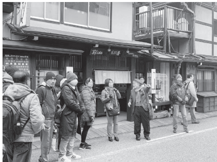
高山市内視察のようす

ルアンパバーン県知事やルアンパバーン市長などが来訪し、高山市における住民参加型の町並み保全や環境に配慮した観光振興の取り組みについて、古い町並や乗鞍岳などを視察するとともに、関係者との意見交換を実施しました。