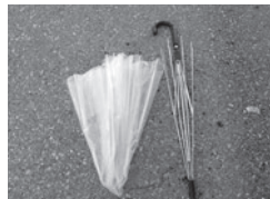
③外した生地は可燃ごみ、骨組みは不燃ごみへ