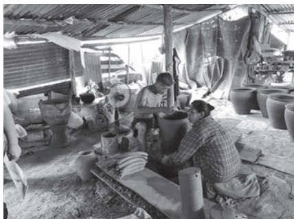
ルアンパバーンでの陶器製造のようす