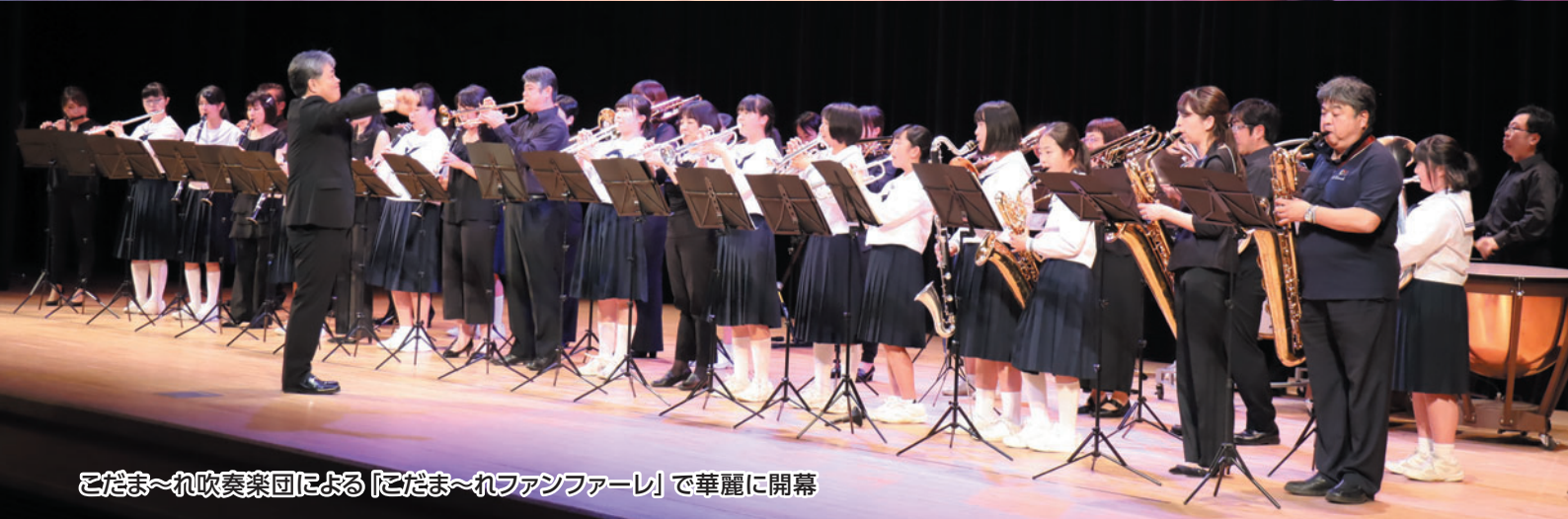
こだま〜れ吹奏楽団による「こだま〜れファンファーレ」で華麗に開幕