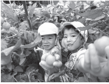
園児たちの野菜収穫の様子

食は子どもから大人まで生涯を通じた課題で、どのような食生活を送るかによって将来の健康を左右します。しかしながら、一日のスタートである朝食の欠食は小中学生でもみられ、その理由は「時間が無い(41%)」「食べたくない(38%)」がほとんどです。朝食は一日の生活リズムと深い関係があり、眠育と平行して進めていく必要があります。朝食をはじめ、特に自立する前の食育には下記のとおり多方面から取り組みをしています。