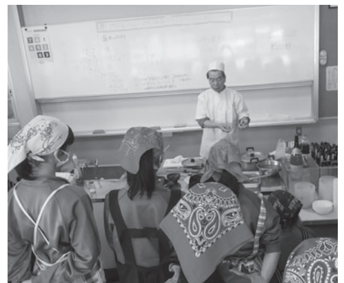
地域講師を招いての食育講座の様子

食事の準備(買い物、調理)に関わることで食への意欲が高まります。家庭は食育の体験学習の場として最適です！始められる事から少しずつ実践していきましょう。