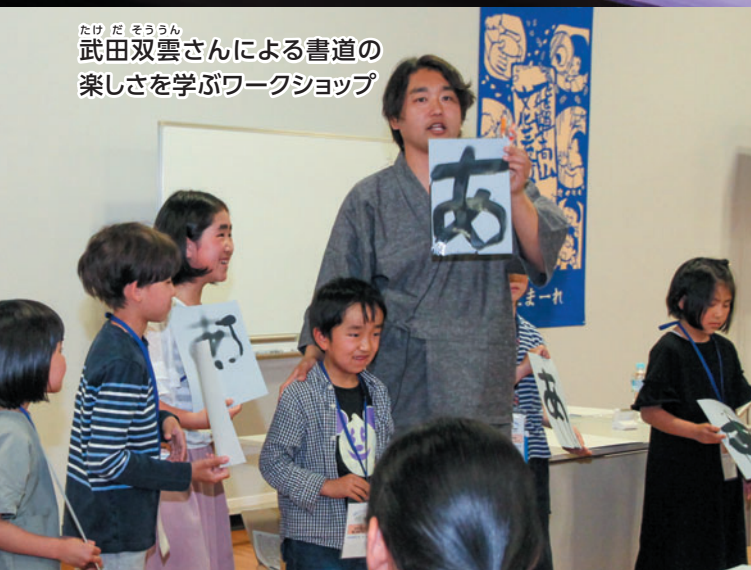
たけだ そうろん 武田双雲さんによる書道の楽しさを学ぶワークショップ