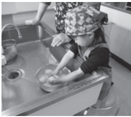
子育て支援センターでの食育体験講座の様子

子育て支援センターでは、離乳食や幼児食の実習を行うことで、同じ悩みを持つ保護者の方が具体的な調理法などを学びながら、子どもと一緒に食べる「食」の