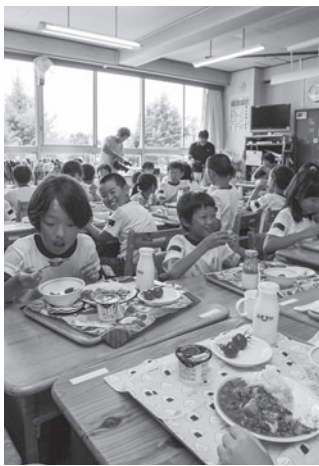
まるとご飛驒の日の様子

子どもたちが「食」に関する正しい知識を持ち、「何を」「どう食べるのか」といった健全な食のあり方を学ぶことができるよう、行政だけでなく地域、企業等と力を合わせて今後も取り組んでいきます。