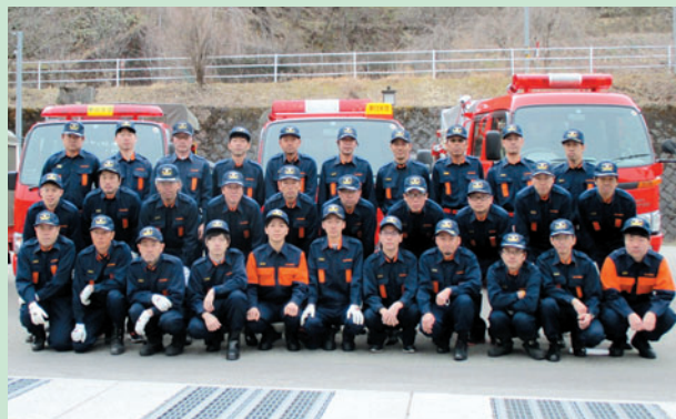
朝日支団 第2分団の皆さん

これからも、地域の皆様が安心して暮らせる地域を目指し、消防団活動を行っていきますので、ご理解とご協力をお願いします。