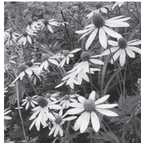
オオハンゴンソウ