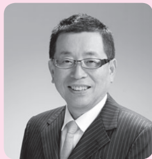
高山市長 國島芳明