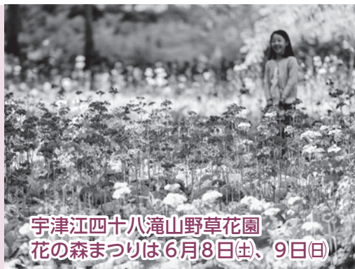
宇津江四十八滝山野草花園 花の森まっりは6月8日(土)、9日(日)