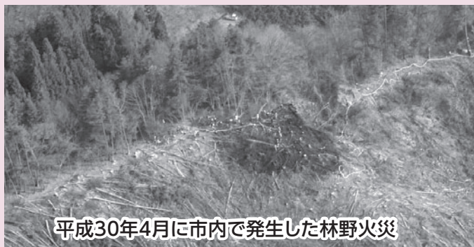
平成30年4月に市内で発生した林野火災