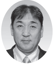
やまこし けいいち 山腰 恵一 (公明党)