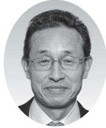
うしまる ひろゆき 牛丸 尋幸 (日本共産党)