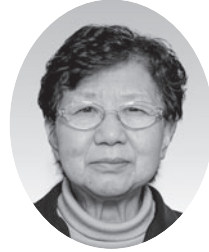
じょうしま きよこ 上嶋 希代子 (日本共産党)