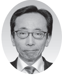
なかおさ ひろゆき 中箴 博之 (公明党)