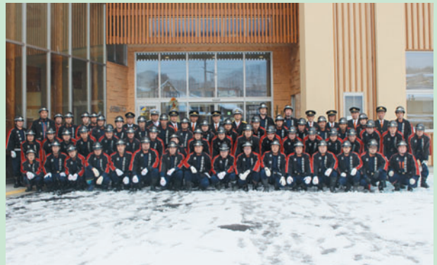
久々野支団 支団本部および第1分団の皆さん