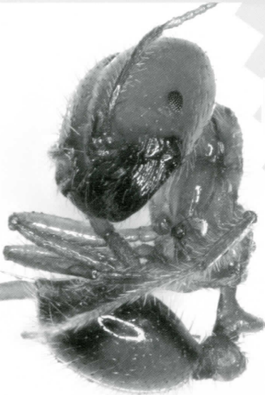
アカカミアリ

岐阜県は、地域によって気候や地形に大きな差があり、飛騨山脈に生息するライチョウや濃尾平野に特有な淡水魚など、多様な生物が見られます。