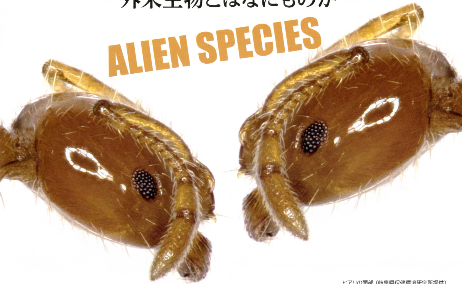
ヒアリの頭部