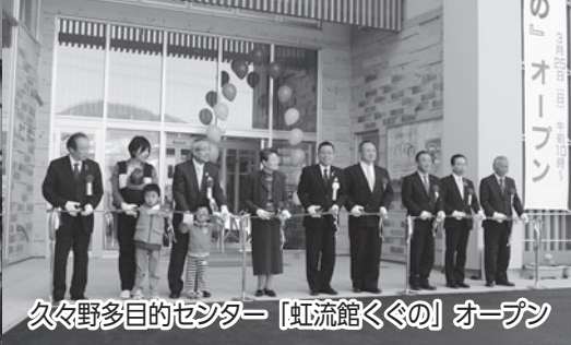
久々野多目的センター「虹流館くぐり」オープン