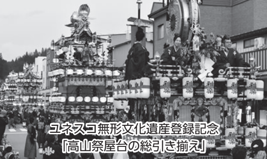
ユネスコ無形文化遺産登録記念 『高山祭屋台の総引き揃え』