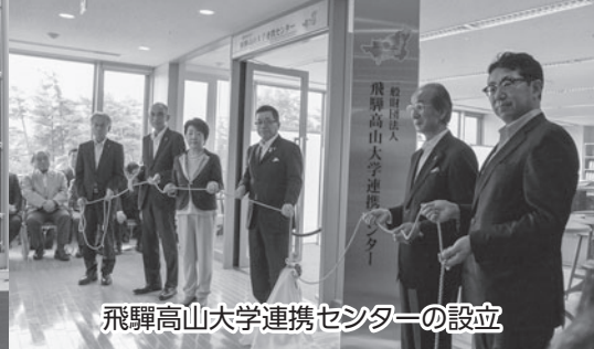
飛騨高山大学連携センターの設立