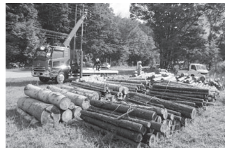
木の駅で間伐材を積みマイカーに積んでいる様子

未利用間伐材のエネルギー利用を進めるため、木の駅に集積された間伐材をトラック「積みマイカー」で毎週収集し、エネルギー原料加工所に運搬します。