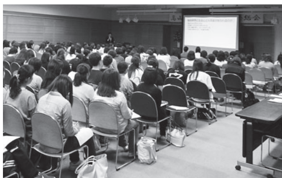
保育士対象の講演会のようす