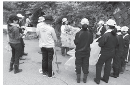
朝日中1年生による防除活動の様子

とても繁殖力が強く、在来植物の生育環境を奪うなど生態系に影響を及ぼすおそれがある特定外来生物のオオハンゴンソウやオオキンケイギクの拡大防止のため、防除作業や特定外来生物防除講習会を開催します。