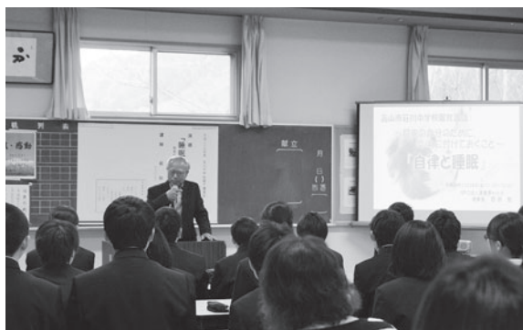
市内中学校での講演会のようす

例えば、小学校4年生の児童は「話を聞いてから毎日9時に寝るようにしました。夜更かしやゲームを少なくなりましたので、おいしい朝ごはんを食べることができるようになりました」