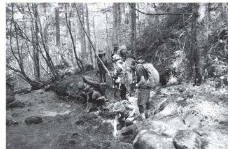
五色ヶ原の森のツアーの様子

乗鞍山麓五色ヶ原の森の新ルート整備にあわせたガイドブック作成や貴重な原生林に関する説明看板等を整備します。