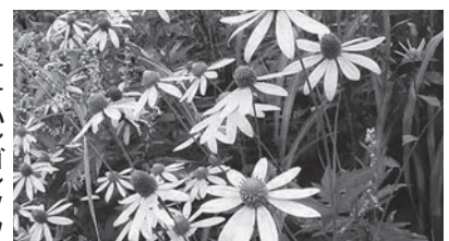
オオハングンソウ

時間 午後7時～8時(事前申込不要、参加無料です。) ※受講者には、外来生物法に基づく防除実施者であることを証する「特定外来生物防除従事者証」を発行します。