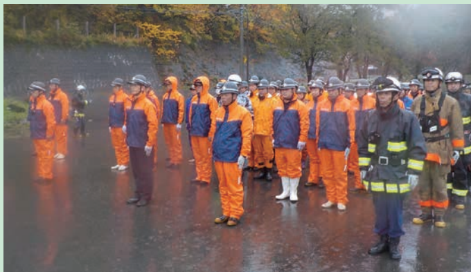
荘川支団 第3分団(畑分団長)以下団員のみなさま

消防団員募集中! 詳しくは消防総務課(☎34-3792) または各支所、最寄りの消防署まで