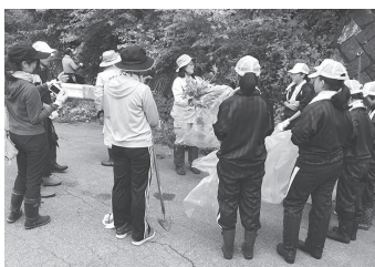
朝日中学校生徒による防除活動の様子

今年度も、地域の皆様や学校において特定外来生物の防除活動を積極的に行っていただいておりますが、拡大を続ける特定外来生物の根絶にむけ、今後も各種取り組みを進めていきますので、引き続きご協力をお願いします。