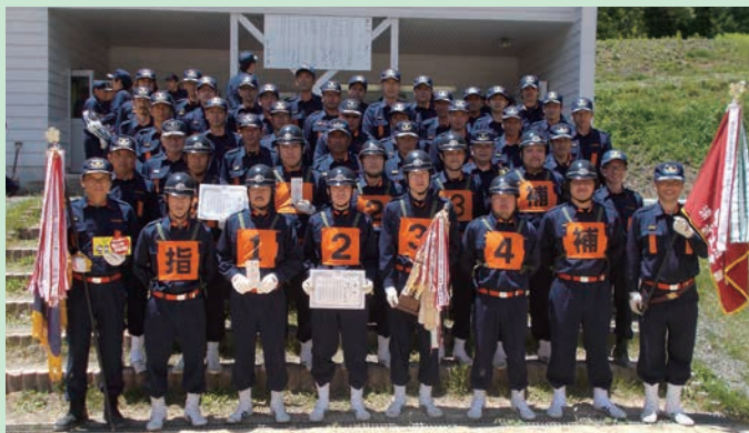
清見支団 第1分団（阿礼分団長）以下団員のみなさま

今後も、自主防災組織との連携を強化し、地域の安全安心のために尽力していきたいと思っておりますので、ご理解とご協力をお願いします。