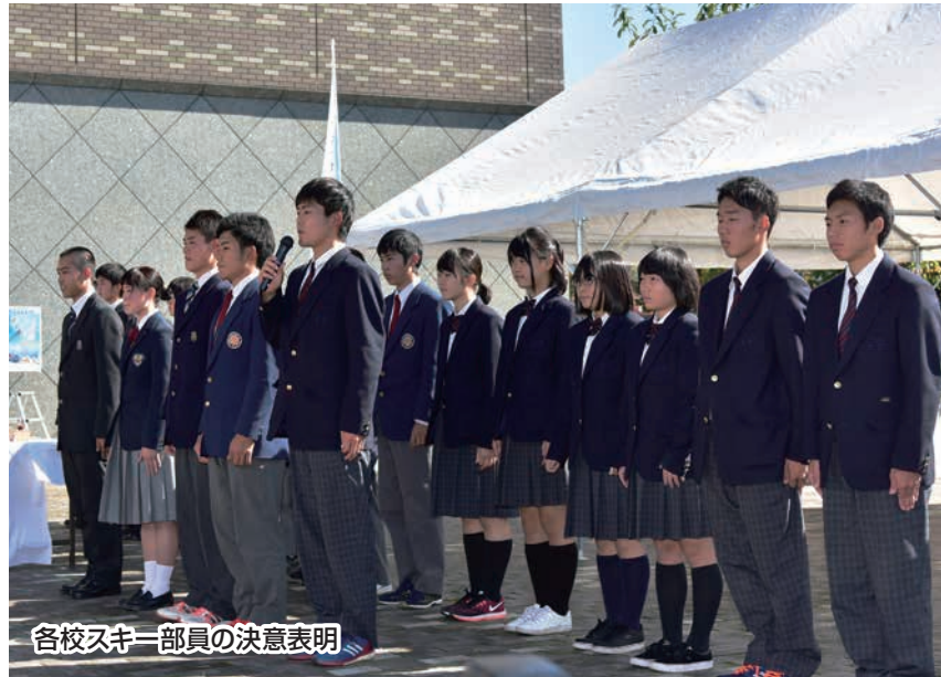
各校スキー部員の決意表明

全国高等学校スキー大会の開催100日前となった10月27日、市役所でカウントダウンボードの点灯式が行われました。