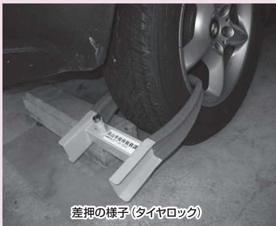
差押の様子(タイヤロック)

市税や国民健康保険料などは、私たちが安心して暮らせるまちづくりに欠かせない公共サービスや公共事業を行うための貴重な財源です。