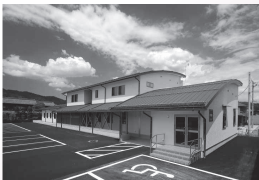
建築物の部：奨励賞 岐阜県看護協会立 訪問看護ステーション高山 ケアプランセンター高山 ナーシンググレイ高山

Hit net TV! 開局10周年 Hits FM開局20周年 初企画! 共同特別番組