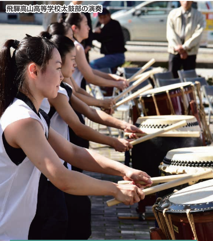
飛騨高山高等学校太鼓部の演奏