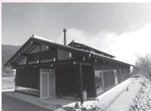
建築物の部：奨励賞 鈴木邸