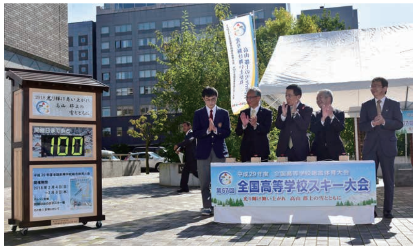
高山工業高等学校が製作したカウントダウンボード

高山市では、平成30年2月4日～8日に「ほおのき平スキー場」でアルペン競技が行われます。ぜひお出かけいただき、高校生のエネルギーを感じてください。