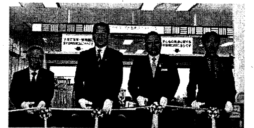
4月3日に行われた子ども発達支援センター開設セレモニー