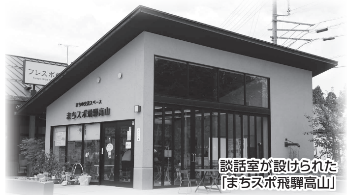
談話室が設けられた「まちスポ飛騨高山」

問合せ先 NPO法人まちづくりスポット ☎62-8550 高年介護課 ☎35-3178