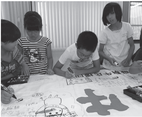
▲参加の小学生から寄せ書きメッセージが寄せられました

高山市飛驒牛応援実行委員会では、今年9月の全国和牛能力共進会を機に、市内の小学生を対象に飛驒牛に関わる様々な体験を通じて、その素晴らしさと魅力を学び、一緒に応援していただこうと「飛驒牛子ども応援団」体験学習を3回にわたり開催しました。