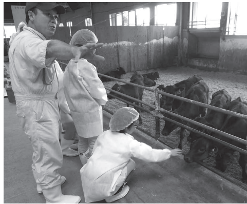
▲県畜産研究所では、飛驒牛の特徴を学習