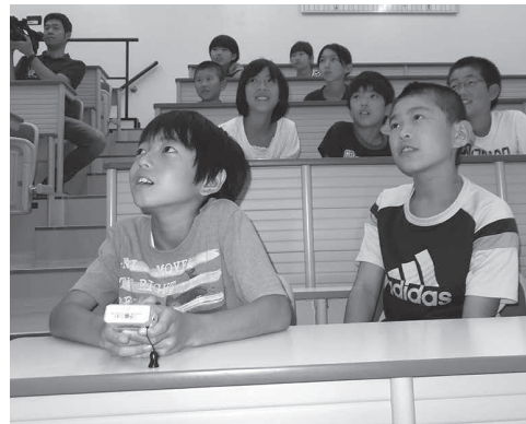
▲JA飛驒ミートでは枝肉の模擬競りを体験

1回目は7月25日に岐阜県畜産研究所（清見町牧ヶ洞）、2回目は7月28日に飛驒食肉センター（JA飛驒ミート）（八日町）、3回目は8月3日に飛驒高山高校（山田町）を会場に開催し、市内の小学生延べ25名が施設見学や歴史学習、作業体験に参加しました。