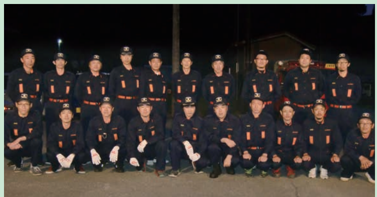
上宝支団 第3分団 大家分団長以下団員のみなさま

今後も、支団、上宝分署、自主防災組織と協力しながら地域の安全安心のために尽力していきたいと思っておりますので、ご理解とご協力をお願いします。