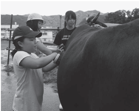
▲飛驒高山高校ではブラッシングを体験