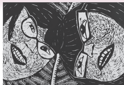
【小中学生部門大賞】日なたぼっこ楽しいね