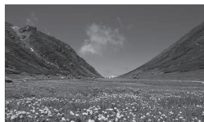
乗鞍岳に広がる花畑

まず、戦後70年以上が経過する中、戦争や広島・長崎への原爆投下の記憶を風化させてはならないとの思いをこめ、私たちが、学び、未来へ伝えるべきこととして「戦争と核兵器の悲惨さ、愚かさ、恐ろしさ、そして命の大切さ」としました。