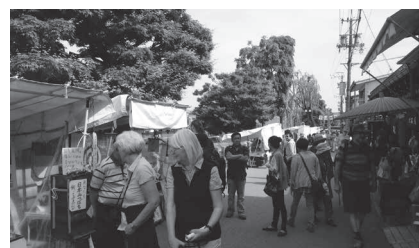
朝市を散策する外国人観光客

その上で、観光は、異なる国や地域の文化や価値観への関心や理解を高め、平和な社会の実現に大きな役割を果たすとした「観光は平和へのパスポート」という国際連合のスローガンなども踏まえ、国際観光都市の市民である私たちが大切にすることとして「多様な文化を理解し、尊重すること」としました。