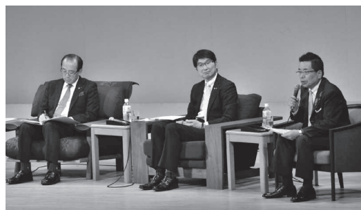
左：広島市長 中央：長崎市長 右：高山市長

戦争被爆地であり、世界規模の平和活動をリードされている広島市長の松井一實氏と長崎市長の田上富久氏をお招きし、高山市長とともに「平和都市宣言」をテーマとしたパネルディスカッションを行いました。