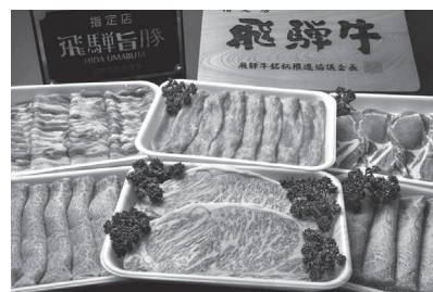
飛騨牛・飛騨旨豚2種セット