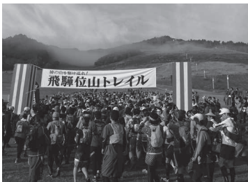
初開催のトレラン。完走者数はロング241/254人。ショート175/175人だった