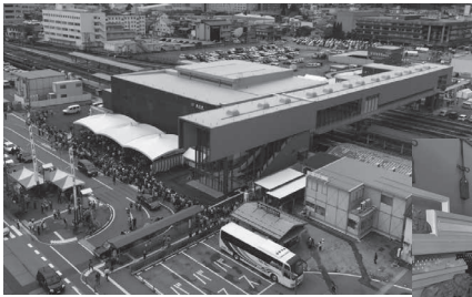
駅の東西を結ぶ匠通りには祭屋台の一部などを展示