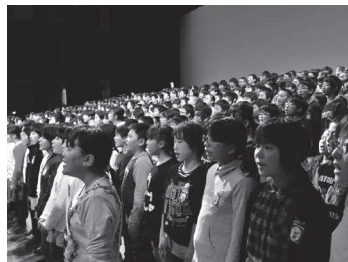
市制施行80周年記念式典では、市内小学校5年生による「大きくなったら」の合唱もあった