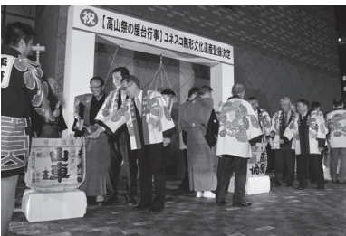
ユネスコ無形文化遺産の登録決定記念セレモニーが市役所で行われた