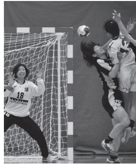
本拠地で初勝利を飾ったブラックブルズ

平成27年10月に開催した高山市平和サミットで広島市の松井市長(平和首長会議会長)から贈られた被爆アオギリ二世の苗木を昭和児童公園(ポッポ公園)に植樹した。