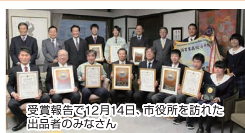
受賞報告で12月14日、市役所を訪れた出品者のみなさん 大会の成功はもちろんのこと、飛騨の米を一層他産地と差別化し、もっと高く売るための努力を市としても生産者や関係団体とともに取り組んでいかなければならないと、あらためて強く思った次第です。 市民の皆様にも、地元米の消費と宣伝に一層のご協力をお願い申し上げます。