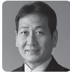
水門 義昭 議長