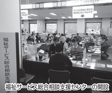
福祉サービス総合相談支援センターの開設