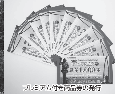
プレミアム付き商品券の発行