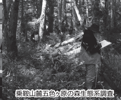
乗鞍山麓五色ヶ原の森生態系調査