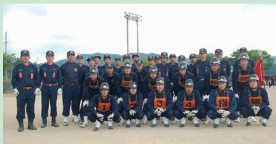
高山支団第3分団 上田分団長以下団員のみなさん

このような地域を守るべく、団員は毎月2回の機械器具点検、春季、秋季等の訓練を欠かさず行い、いざという時のために準備を整えています。