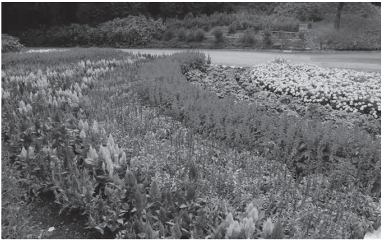
50周年記念特別大賞 双和寿会下保の千光寺花壇

市民憲章推進協議会が主催するフラワーコンクールの審査が8月29日に行われ、50周年記念特別大賞に丹生川町下保の双和寿会下保が選ばれました。