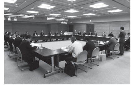
5月9日開催の協議会

「空家等対策計画」の策定や計画に基づく対策の実施などについて協議するための、協議会を設置しました。 市の関係課、飛騨建築事務所、警察のほか、建築、不動産、法務、福祉、住民、歴史文化、商工、まちづくり、防犯などの各分野からの代表者に参画をいただきました。 議論の内容等は、今後市ホームページ等で紹介していきます。