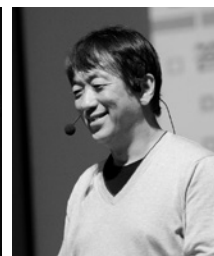
みやだいしんじ 宮台真司教授