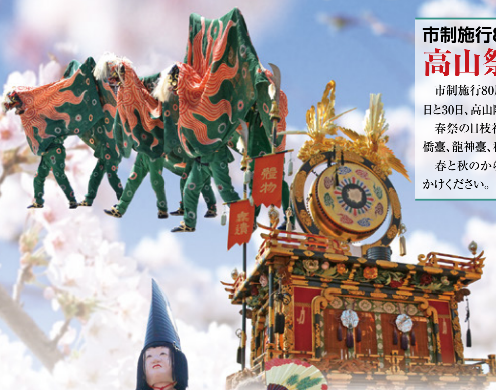
日枝神楽臺【春】 ひえかぞらたい