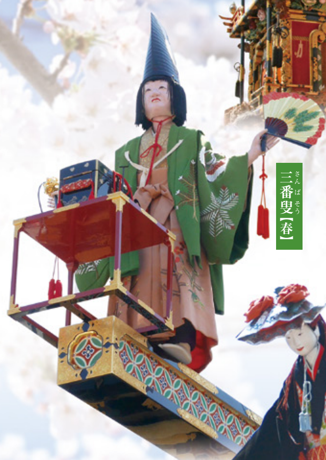
三番叟【春】 さんぼそう