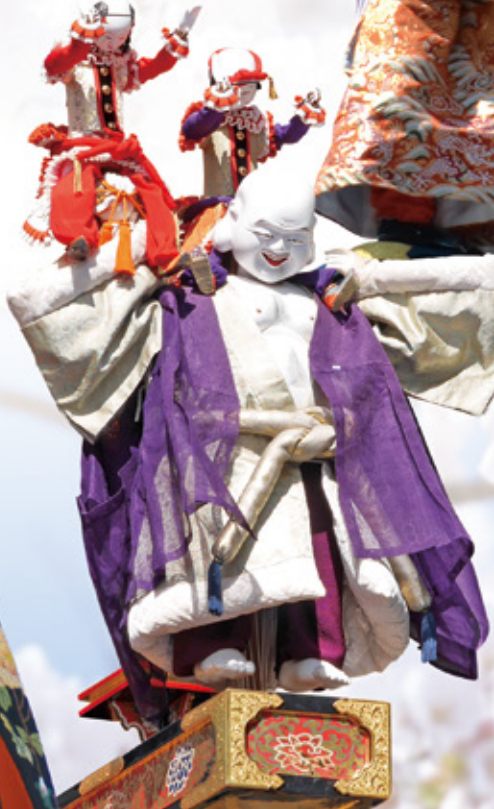
布袋臺【秋】 ほていたい