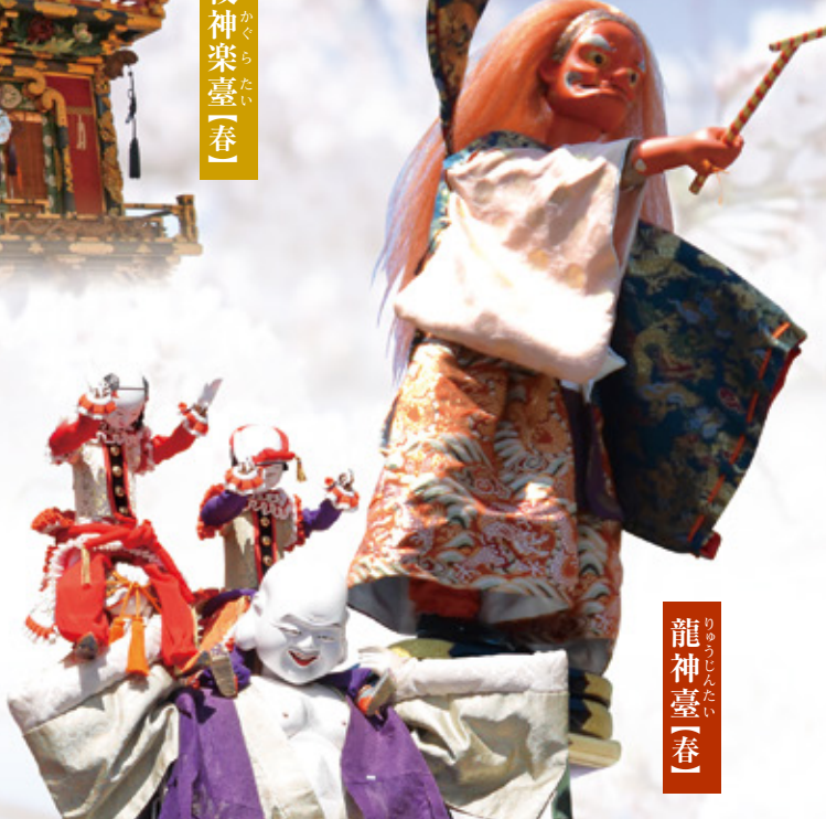
龍神臺【春】 りゅうじんたい