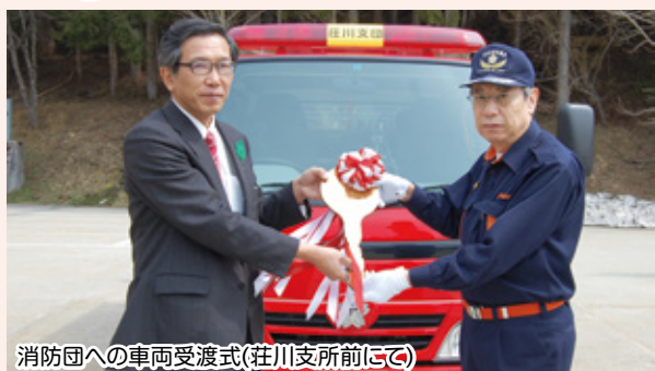
消防団への車両受渡式(荘川支所前にて)

小型動力ポンプ付積載車の更新に伴う消防団への車両受渡式が3月30日(水)に行われ、荘川支団の野々俣班、国府支団の糠塚班にそれぞれ配備されました。