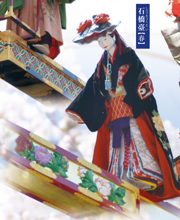
石橋臺【春】 いしはしうたい