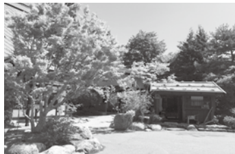
緑のある修景の部: 奨励賞 ほっこり里庭