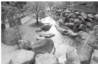
緑のある修景の部: 奨励賞 いわたちの楽園