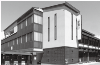
建築物の部: 特別賞 匠館