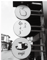
サインの部: 奨励賞 茶房卯さき