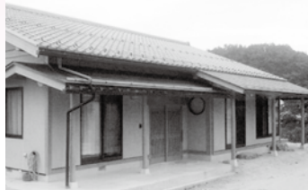
建築物の部: 奨励賞 中嶋邸