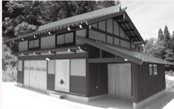
建築物の部: 奨励賞 西岡邸