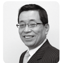
高山市 くにしま みちひろ 國島 芳明 市長