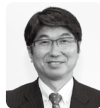
長崎市 たうえ とみひさ 田上 富久 市長