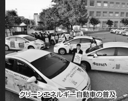
クリーンエネルギー自動車の普及