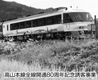
高山本線全線開通80周年記念誘客事業