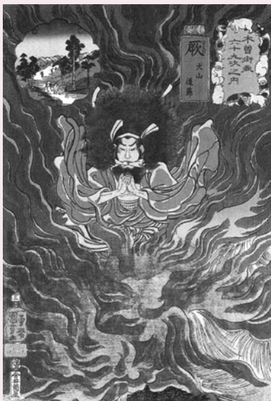
木曾街道六十九次之内 藤 犬山道節

※後期展示は8月25日(火)～ 時間 午前9時～午後4時 期日 8月30日(日)まで 時間 午前9時～午後7時 ※場所はいずれも飛騨高山まちの博物館(入館無料)です。