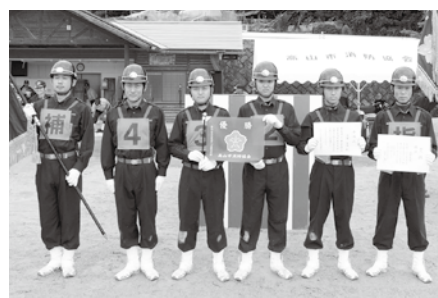
優勝した上宝支団のみなさん