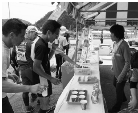
八日町新鮮野菜販売所 (87.4キロ地点)