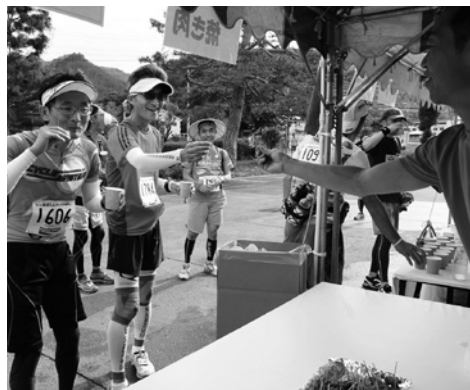
公文書館 (93.3キロ地点)