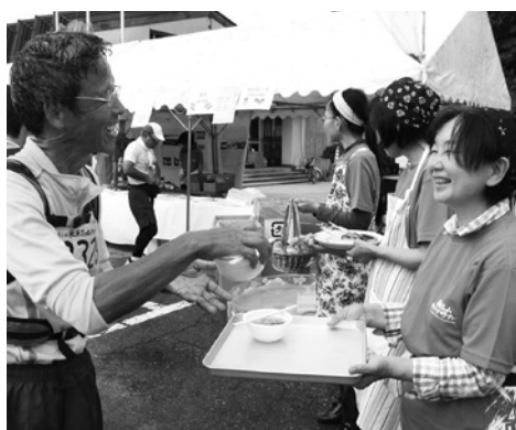
国府B&G海洋センター (74.1キロ地点)