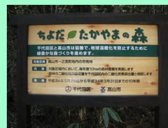
ちよだ・たかやまの森