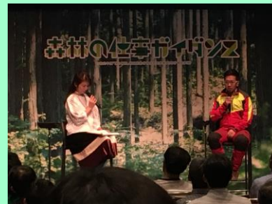
森林の仕事ガイダンス