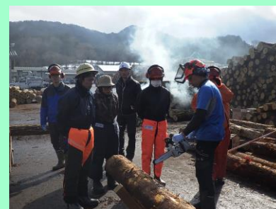
チェーンソー講習会