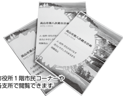
市役所1階市民コーナーや各支所で閲覧できます

総合計画は、長期的な視点から市の将来の姿を描きながら、その実現に向けて計画的な行財政運営を行うため、まちづくりの方向性を総合的、体系的にまとめたもので、市の最上位計画として市政運営のもっとも基本となる指針です。