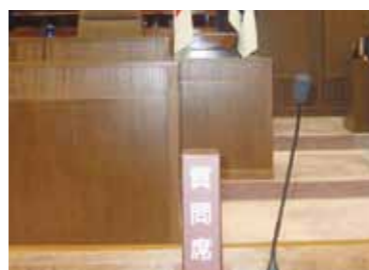
議場で新たに設置された質問席

最初に、「議会のあるべき姿」について議論し「広大な地域におけるまちづくりの責任ある意思決定機関として、市民の負託に応えるべく、議員相互の議論を深めて合意形成を図り、わかりやすく開かれた