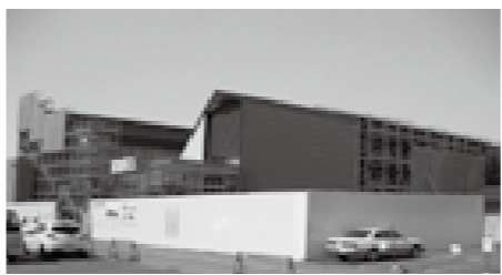
国府支所庁舎新築工事現場

〔議第40号〕本郷小学校屋内運動場改築工事（建築）請負契約の変更について 主な質疑は次の通り。 【問】建築確認が下りる前に契約したということだが、そういうことはよくあるのか。