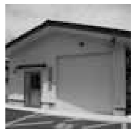
丹生川支団町方消防団車庫

【問】 図書館の図書購 入費は指定管理料の中 に含んでいるのか。 【答】 含まれている。