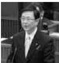
村瀬 祐治 議員