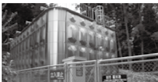
丹生川簡易水道坊方配水池

するものと決めました。 主な質疑は次の通り。 【問】土地の所有はどうなっているか。 【答】市の土地と、一部借地がある。借地は、契約期間が切れるので、更地にして返す。 【問】土地・建物の今後の利用はどうなるか。 【答】用途廃止をして普通財産に切り替えた後、土地・建物ともに有効活用できないか検討している。