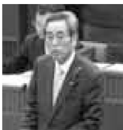
石原 孫宏 議員

【答】本格的に大きな人口減少が始まったと受け止めている。人口減少に関して、市で行える総合的な対策について全庁的に連携しながら取り組んでいく。