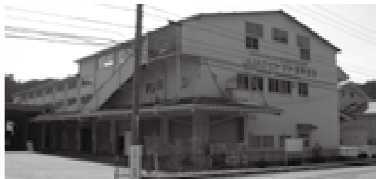
JAひだトマト選果場

道路改良工事、橋りょう耐震工事の前倒し 1億6500万円 文化会館の駐車場用地の購入 8730万円 扶助費の返還と介護保険の繰出金 479万円