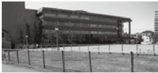
高山市民文化会館の駐車場

・地方債の繰り上げ償還 5064万円 ・基金の積立 19億2696万円 ・駅周辺整備事業費などの減額 △7億5200万円 合計22億7619万円は、普通交付税11億4942万円、国の支出金△1900万円、県の支出金5億9967万円、繰越金10億8831万円、寄付金196万円、基金繰入金△8億4937万円、※