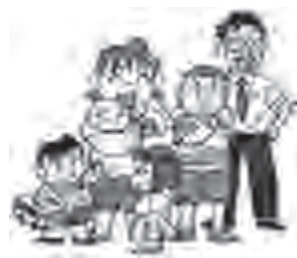
幼児から高校生まで

した高山市で、地域審議会や地域振興特別予算を含めた今後のまちづくりのあり方を考えるヒントが得られるものと期待しています。 ② 児童養護施設・こども家庭支援センター（社会福祉法人樹心会（揖斐郡大野町）） 子どもを取り巻く環境変化の中で、多様化する児童養護施設のニーズと子どもが安心し