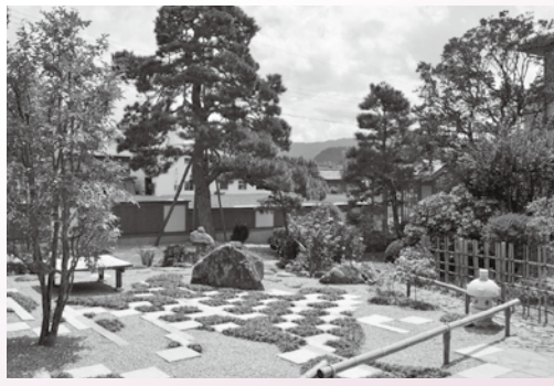
緑のある修景の部：特別賞 春恵の庭

※奨励賞は優秀賞の次点。特別賞は景観への高い配慮が認められる作品などに対する表彰。 ※今回はサインの部の受賞はありませんでした。