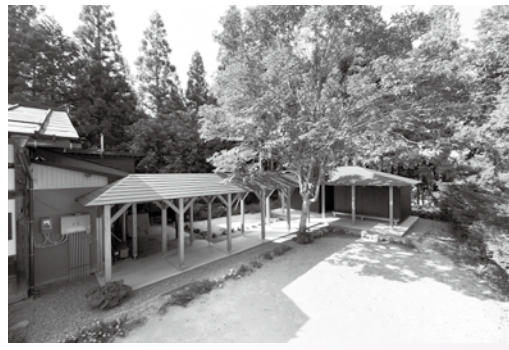
建築物の部：奨励賞 大隆寺の休憩所