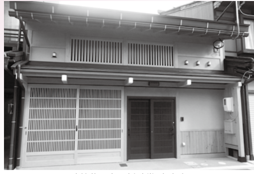
建築物の部：奨励賞 古家邸