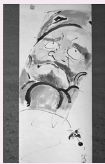
あらあき ぶんぼう 様 文峰「嵐の絵に雑煮の句」

市内の家庭に保管され、暮らしの中で使われてきた思い出深い品々や高山城の全容が分かる模型、復元推定図など、近年収集した貴重な資料の数々をテーマ別に紹介します。