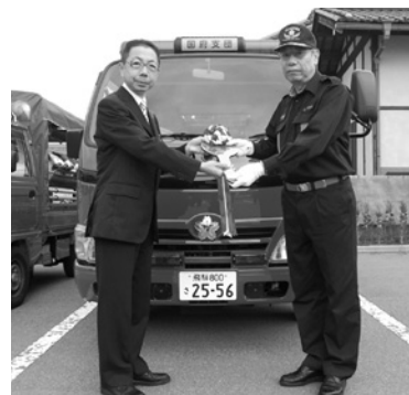
消防団への車両受渡式 (こくふ交流センター前にて)